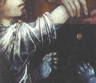
Il dettaglio all'ultravioletto di questo particolare della Cappella Strozzi mostra gli interventi pittorici a secco (luminescenze)